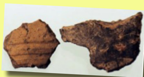
Keramikfragment av vikingatida typ.