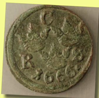
Mynt från 1666