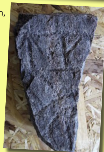
Runstensfragment påträffat 2017